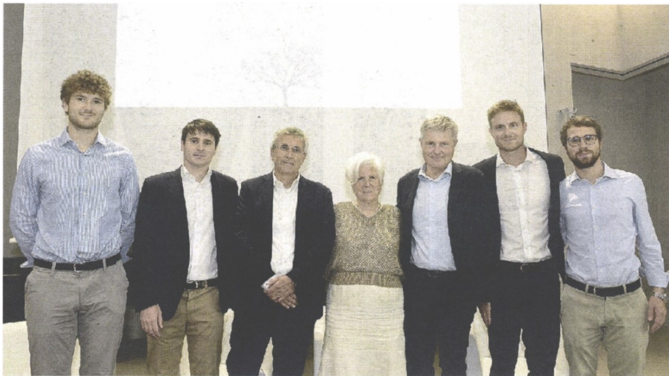
NUOVA FONDAZIONE Presentata ieri l'iniziativa della famiglia dedicata al fondatore dell'impresa