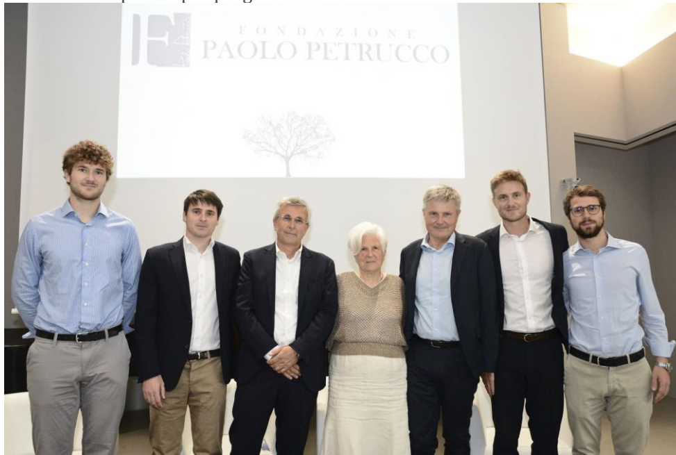
Foto di famiglia

finalità all'intersezione tra obiettivi sociali e culturali nei quali possiamo essere utili e coinvolgeremo un comitato scientifico di alto profilo per progettare i nostri interventi”.